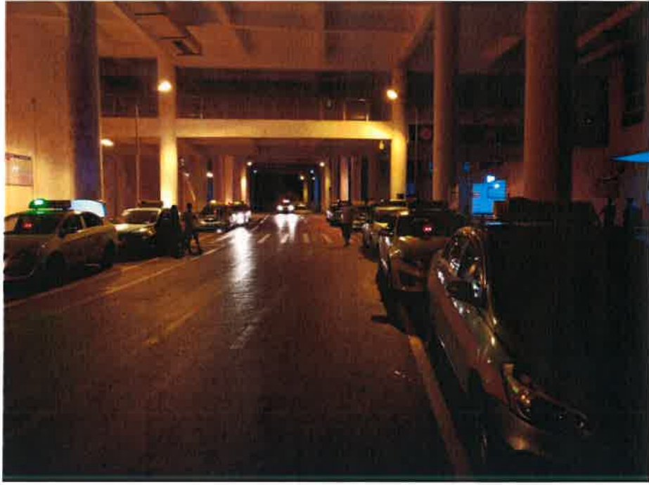
巴中火车站整治效果

下一步，巴中市交通运输综合行政执法支队将按照专项整治要求，联合公安，交警，城管，广场办等相关单位，加大执法力量，强化日常监管，重点打击喊客、拉客、扰乱火车站、汽车站秩序行为，严肃查处出租汽车拒载、绕行、索要高价行为，严厉整治非法营运行为，确保群众出行安全。同时，建立常态化行业监管机制，持续深化综合治理，着力解决一批群众反映强烈的烦心事、揪心事、操心事，为庆祝建党 100 周年，成功创建第七届全国文明城市做出交通运输之力。